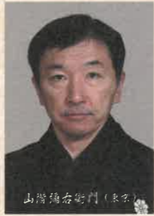
山階彌右衛門 (東京)